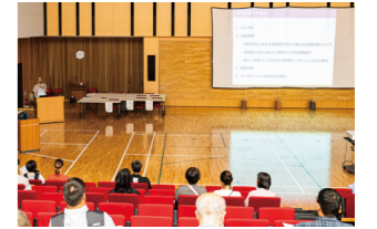
タウンミーティング (2025年6～7月)

つなぐ学び ひらく未来 子どもの学びをつなぐ・子どもの育ちをつなぐ・ 教職員の意識をつなぐ・家庭と地域の絆をつなぐ