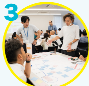
3 御所市における未来の学校を考える