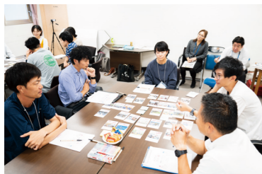
教職員ワークショップ (2024年10月)

2024年度には、御所市における将来的な学校再編を見据え、今後5年間の小中学校の連携の視点や取組内容を示した「御所市学校教育ビジョン」を策定しました。このビジョンづくりにおいても、教職員や市民の皆さんを対象としたワークショップを実施し、子どもたちがこれからの時代に求められる力を育むための基本目標や、それらを実現するための学校間や地域・保護者との連携の視点などを整理しました。