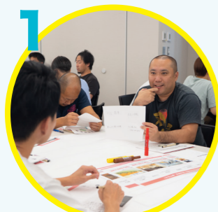
1 学校を越えた先生同士の自己紹介