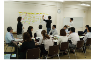
庁内検討会議 (2025年5月)