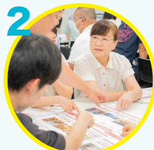
2 事例から最新の学校の設計や運営を学ぶ