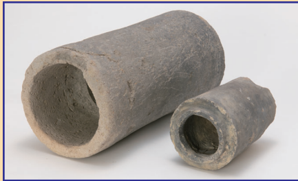
水泥古墳の土管（排水管）