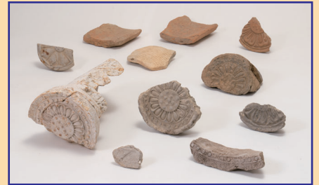
金剛山麓の古代寺院の瓦