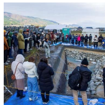
4. ネコ塚古墳 現地説明会

アクセスはこちらの URL か右の QR コードから https://www.instagram.com/bunkazai_gosecity/