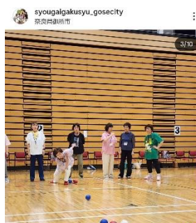
第7回ボッチャフェスティバル