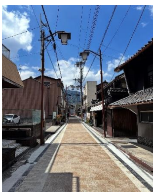
2. 御所まち 美装化