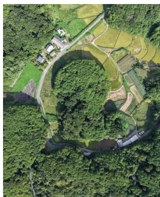
1. 掖上罐子塚古墳 航空写真