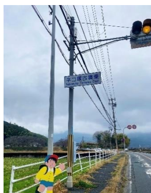
3. ネコ塚古墳東の 名称看板