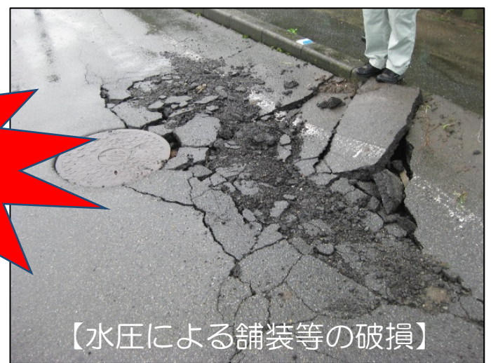
【水圧による舗装等の破損】