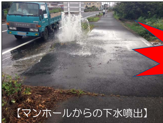
【マンホールからの下水噴出】

【原因】 雨水を流す雨樋などの排水が、「污水管」につながれていることや雨天時に汚水ますの蓋を開けて宅内の雨水を排水していること等が原因です。