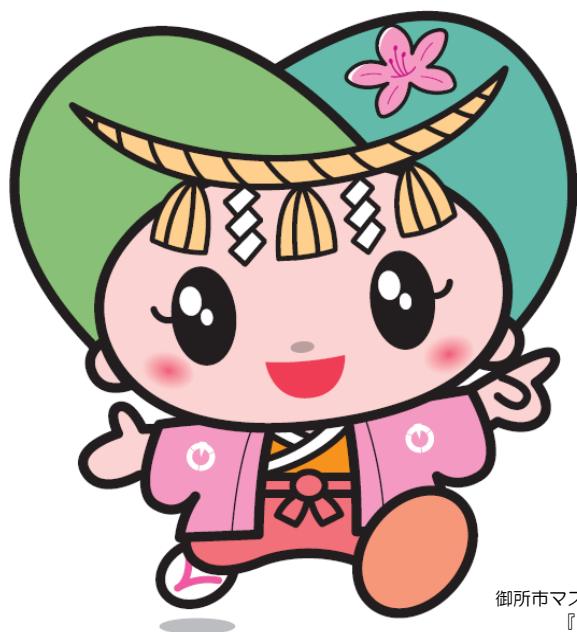
御所市マスコットキャラクター 『ゴセンちゃん』

ご不明な点は、 保証協会 保証支援部 (0742-33-0552) または 御所市農林商工課 (0745-62-3001) までお問い合わせください。