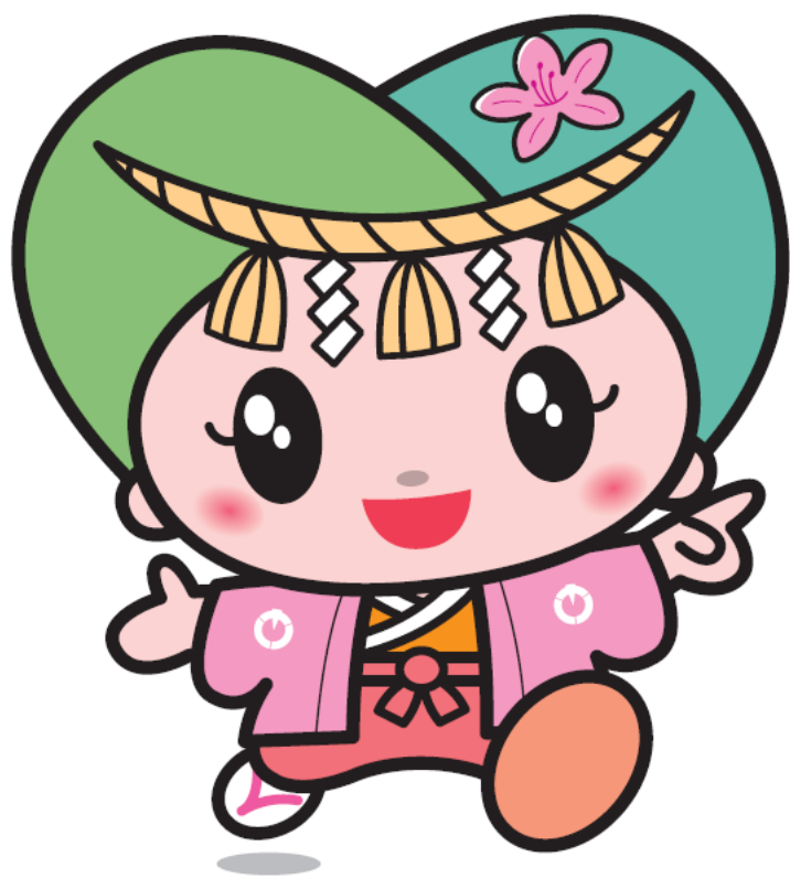
御所市マスコットキャラクター 『ゴセンちゃん』