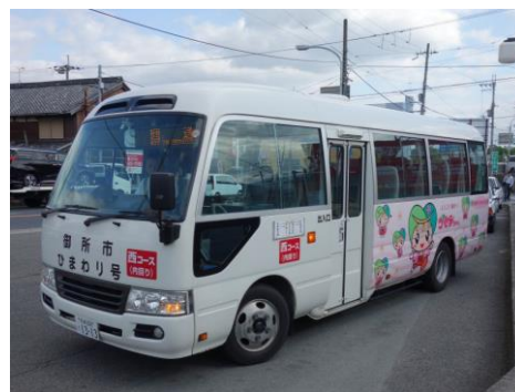
コミュニティバス車両