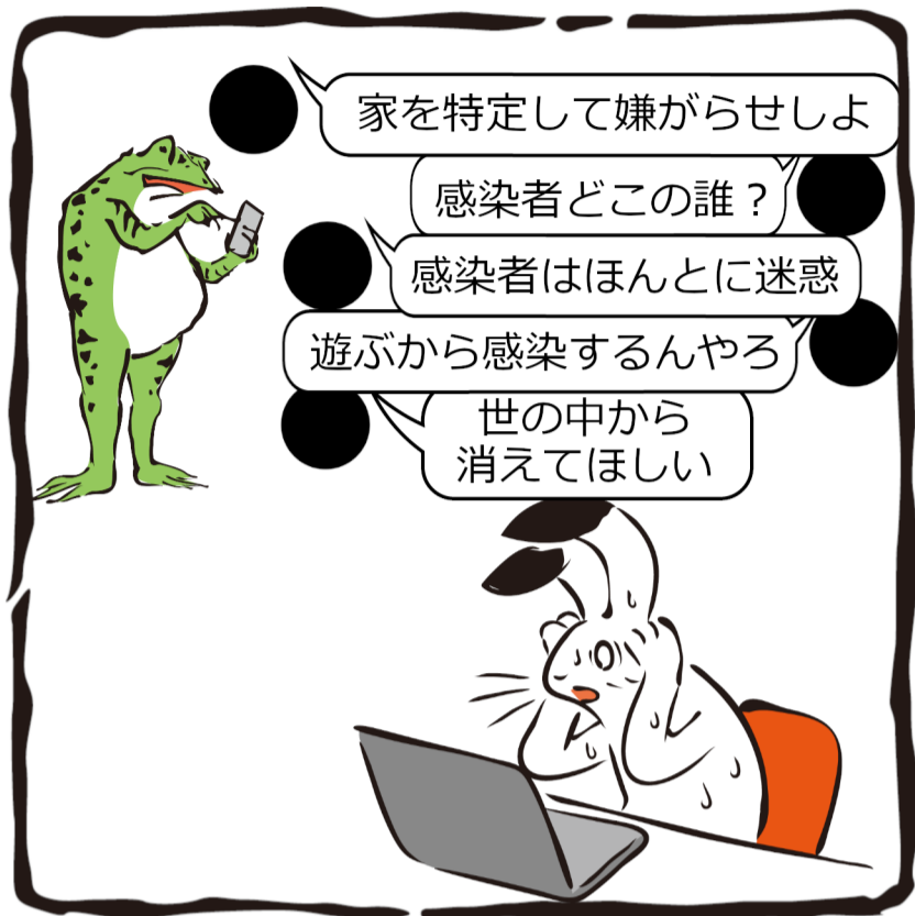
インターネット上の誹謗中傷