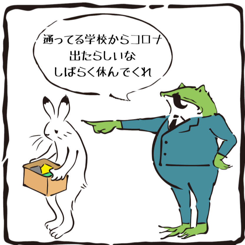
理不尽な出勤停止